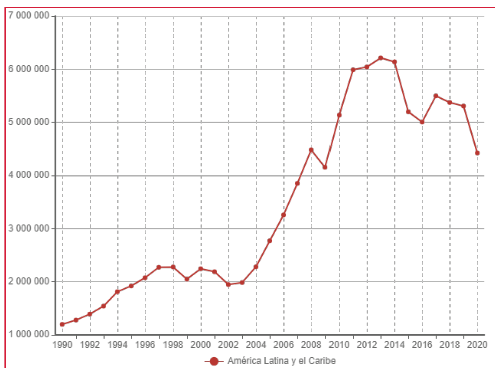
Figura 2. Producto Interno Bruto (PIB) total anual a precios corrientes en dólares (Millones de dólares).

La tendencia en los últimos años del PIB, es decreciente para América Latina, desde un quinquenio antes de la pandemia del Covid-19.